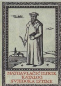
"Katalog svjedoka istine", ponajveće Vlačićevo djelo

Vlačić je stekao velike zasluge objavljivanjem javnosti nepoznatih tekstova i svojom erudicijom na polju literature onoga doba, čime je umnogome zadužio povijesnu znanost i bio uzor povjesničarima svog i kasnijeg vremena